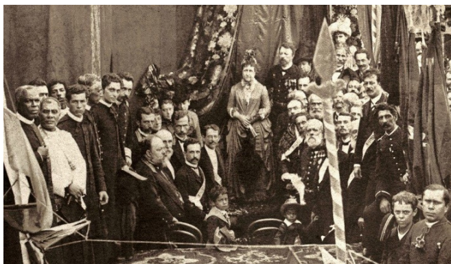
Detalhe da foto “Missa campal celebrada em ação de graças pela Abolição da Escravatura no Brasil”, de autoria de Antonio Luiz Ferreira, 17 de maio de 1888, Rio de Janeiro.