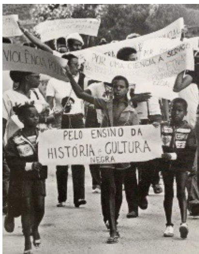
Manifestação durante a reunião da Sociedade Brasileira para o Progresso da Ciência (SBPC), em Salvador, 1981.