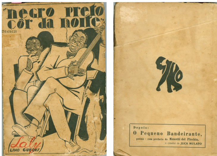
Imagem 5: Negro Preto Cor da Noite , 1937. Capa de Rosasco. Estabelecimento Gráfico Cruzeiro do Sul. Coleção Hendi.