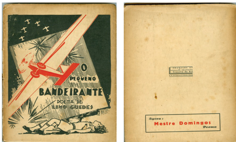
Imagem 6: O Pequeno Bandeirante , 1937. Coleção Hendi. Estabelecimento Gráfico Cruzeiro do Sul. Ilustração e capa de Messias.