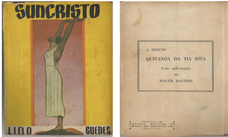
Imagem 9: Suncristo , 1950. Coleção Hendi. Capa de Messias. Empresa Gráfica da "Revista dos Tribunais".

Último livro, anunciando um próximo, com prefácio de Bastide.