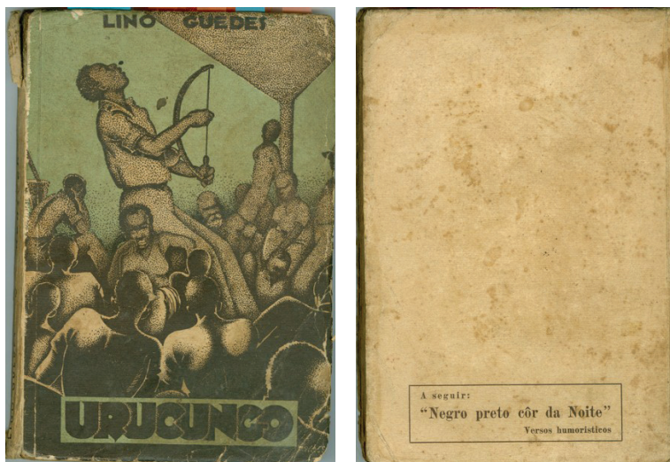
Imagem 4: Urucungo , 1936, Estabelecimento Gráfico Cruzeiro do Sul. Início da Coleção Hendi, anunciando próximo livro.