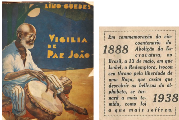
Imagem 8: Vigília de Pae João, 1938. Coleção Hendi. Typographia Cruzeiro do Sul. Capa, desenhos e selo interno de Messias.